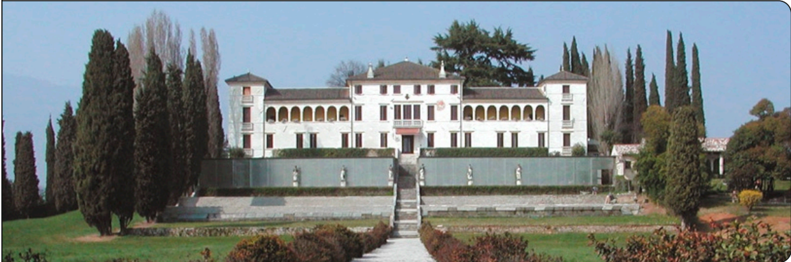
Außenansicht der Villa