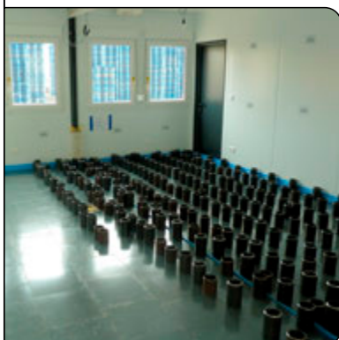
Verlegung der MB-Stahl-Deckplatten

Auch die 2014/15 neu erstellten eigenen Verwaltungsräume am Hauptstandort Bonn sind stilecht als Containerlösung errichtet worden. Beheizt werden die Büros und der Sanitärbereich mit dem MB-Fertigboden S18, der mit seiner geringen Aufbauhöhe von nur 18 mm die Lösung bietet, um auch im Container mit bodentiefen Fensterflächen zu arbeiten.