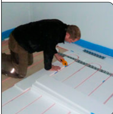
Verlegung des MB-Fertigbodens S18

Die Firma Baumann aus Bonn bietet alles, was mit Containern zu tun hat: Vom Fracht- und Lagercontainer über Messe- und Eventcontainer bis zu Wohn-, Büro- und Mannschaftscontainern. Besonders spezialisiert ist die Firma Baumann auf modulare Raumsysteme - von der Planung über den Transport bis zur schlüsselfertigen Montage.